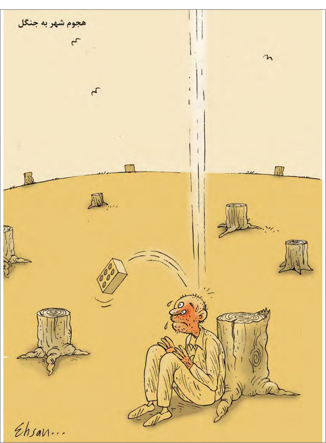
هجوم شهر به جنگل

احسان گنجی | کار نویسند | ehsanganj58@gmail.com