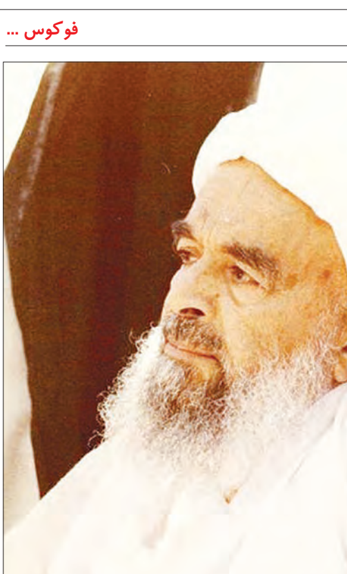
۳۳ سال پیش، برابر با یازدهم تیر ماه ۱۳۶۱ خورشیدی، آیت الله محمد صدوقی، روحانی برجسته شیعه، در عملیاتی تروریستی و در محراب نماز بر اثر انفجار نارنجک به شهادت رسید. آیت الله صدوقی از نسل شیخ صدوقی بود و پدرش ملا ابوطالب وجد دوم او علامه ملا محمد مهدی کرمانشاهی در زمان فتحعلی شاه قاجار به شهر یزد تبعید شده بودند. آیت الله صدوقی پس از پیروزی انقلاب، به نمایندگی مردم یزد در مجلس خبرگان قانون اساسی و امام جمعه این شهر شد.