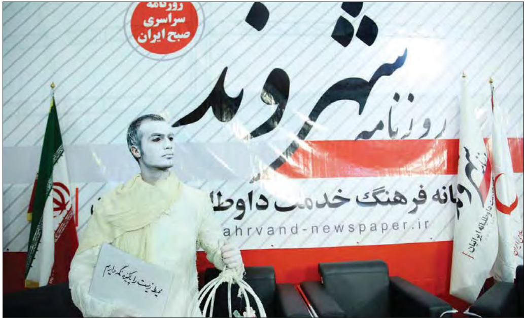
مدیران مسئول و سردبیران جدید کثیرالانتشار از نقش ترویجی هلال احمر می گویند