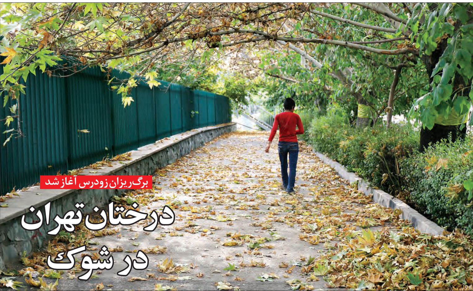
برگ‌ریزان زودرس آغاز شد