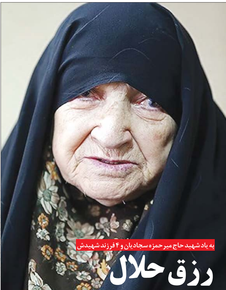
به یاد شهید حاج میر حمزه سجادیان و ۴ فرزند شهیدش