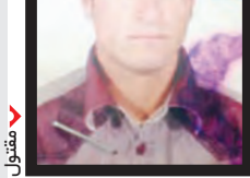
چهارمردی که قاتل فرزندان را بخیلند