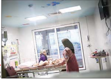
گزارش ویژه مرموزی شناخته می شود