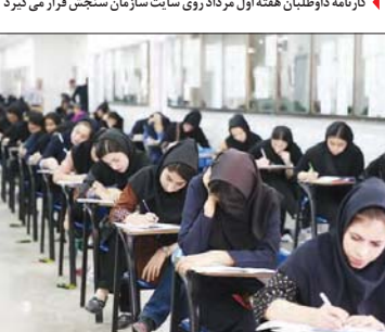
کارنامه داوطلبان هفته اول مراد روی سایت سازمان ستیجش قرار می گیرد