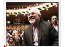
مدیران جدید تئاتر «عاشقانه‌های ناآرام»