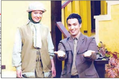
مدیران جدید تئاتر «عاشقانه‌های ناآرام»