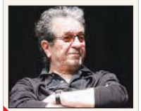
مدیران جدید تئاتر «عاشقانه‌های ناآرام»

دایوش مهرجویی به‌عنوان یکی از بهترین آثار جشنواره فیلم فجر در فهرست نهایی قرار گرفت. نمایش «مده» را از آذر و دی در ایرانشهر به صحنه می‌برد.