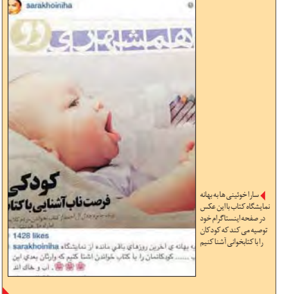
بوفانه بی کلوزن روزنامه باقی مانده از نمایشگاه sarakhoiha در صفحه اینستاگرام خود