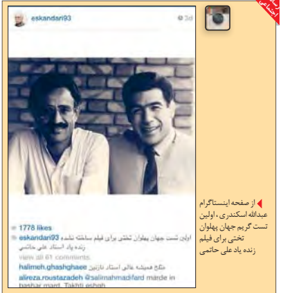
اولین تست گریم جهان پهلوان زنده یاد علی حاتمى

شما از آن دسته افرادی هستید که به محض فرا رسیدن تعطیلات پشت سر می مانید و مناسبت اخیر، راهی سفر می شوید؟ یعنی تنها برنامه گذران تعطیلات برای شما هم، انتخاب گزینه سفر است؟ اتفاق من خیلی به ندرت، امکان رفتن به سفر را دارم. مشغله مانع از انتخاب گزینه سفر می شود. اما اگر فرصتی هم دست دهد، تریج من هم مسیریهای کوتاه انتخاب کنم و بیش از مسافت و جاده، از خود محیط استفاده کنم. سفرهای کاری و دانشگاهی هم وجود دارد که فایده، موضوع سوال شناسیت تفقا فرصت نماندید با علاقه مند به سفر نیستید؟ مقدار زیادی به خاطر تعهدات کاری است اما خیلی هم روحیه سفر ندارم. اتفاق خوبی نیست اما به هر حال، کار بیش از اندازه به یک عادت برای من تبدیل شده است. آسانساز اگر فرصت و فراغتی داشته باشید، تنها راه گذران تعطیلات شما، سفر است؟ سفر تعطیلات فرصتی برای پرداختن به اموری است که در شرایط زمانی امکان آن فراهم نیست. که اگر موضوع روزنامه در گزارش های منتشر شده برای آرامش مطرح باشد، باز هم می توان برنامه های