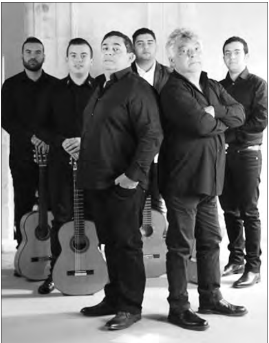
گروه اصلی جیپسی کینگز در تهران