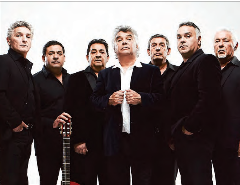
گروه اصلی جیپسی کینگز در تهران