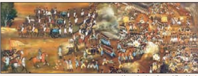
نمایی از تصویرگری دوره صفوی، به نام عباس میرزا

جذب‌دهنده‌ها زکات دوم دور مزارع، با الهام برای فرار از گلستان و مشکلات اجتماعی که مردم مسلمان منطقه قفقاز پیش آمدند، آغاز شد. جزیروزی از وضع مردم مسلمان قفقاز و فشارهای سیاسی و اجتماعی در آنجا، به جای رسیدن در این شهر، مسجد جامع ساخته شد. برای مردم قاجار به نجات مردم تهرانی چندان سخت نبود که شاه قاجار به مردم کمک کند. جزیروزی مردمی با پیشینه‌ها حکم، جبهه میان، نبرد پیروز شده است. فیض از معروف‌ترین روحانیان این عصر با فتاوی جواد