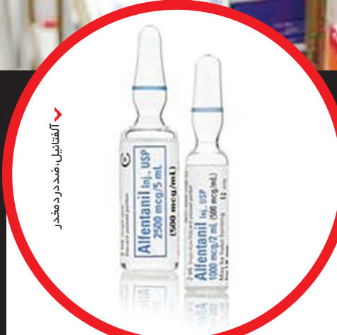
آلفتانیل، ضد درد مخدر

بیمارستان را به دلیل توجه نکردن به وضع همکاری‌شان یکی از دلایل مرگ همسر می‌دانم. اگر مواد بیهوشی به این راحتی در دسترس همسر من نبود و نظارت دقیقی روی این بخش وجود داشت او هرگز نمی‌توانست این دارو را برای مصرف شخصی استفاده کند.