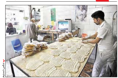
ما مر بلباسی ساکن شـهر لکان رشت، ه ۱ سـال است کهپیشـهاش نانوایی اسـت. او به دلیل شدت علاقه اش مکتابخوانی از ۶ ماه پیش کتاب هایی را داخل نانوایی آور ده تا مشـ تریان در زمان انتظار در صف، وقت خود را صرف