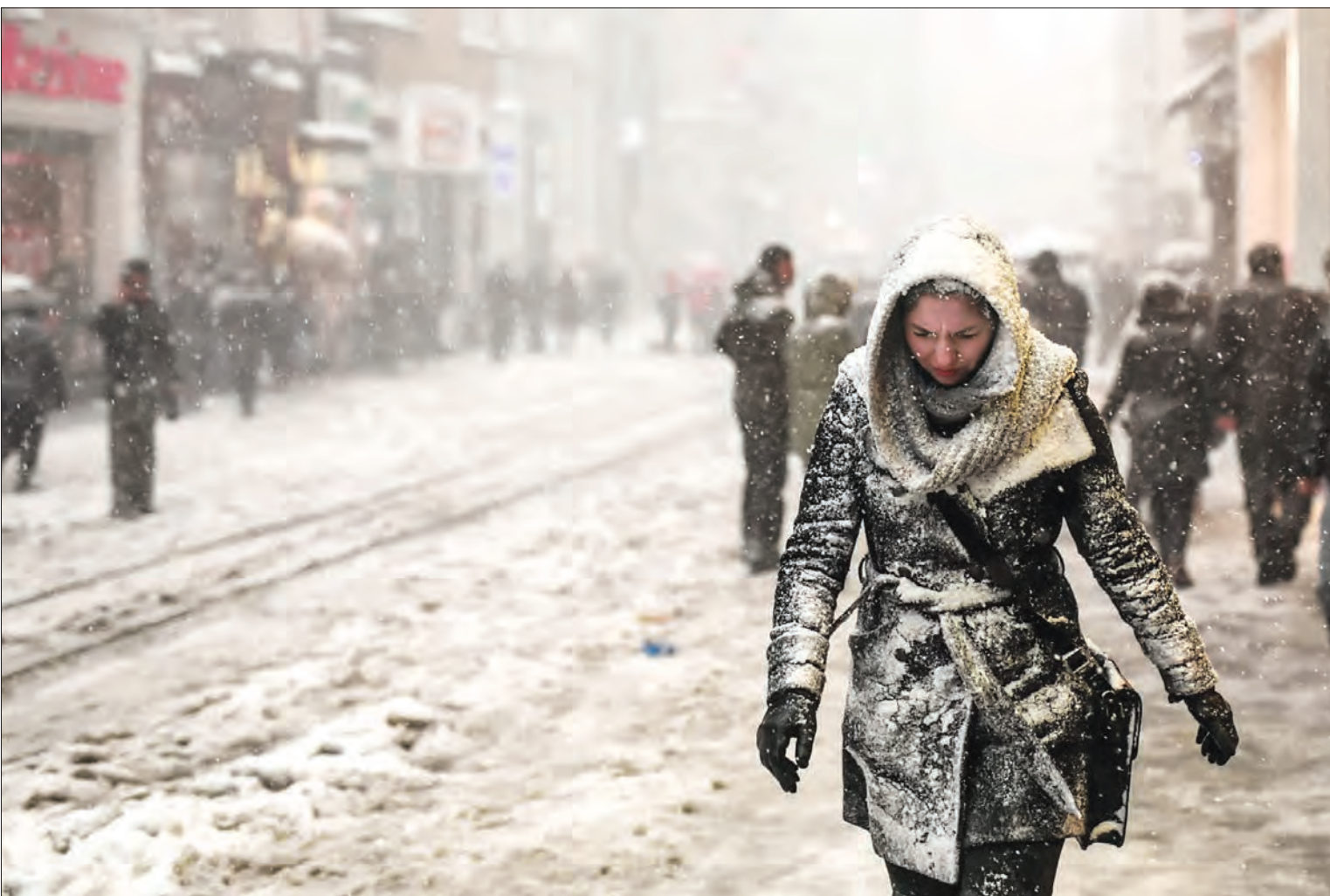
تُرک‌ها هم «فردگرا» تر شده‌اند