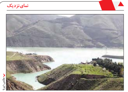
م ظر فیت ذخیره آب سد لتیان با بارندگی های اخیر در بخش رود بار قصر ان پر شده و دریچه های سد به ظور انتقال آب پشت سد به سمت سد ماملو باز می شود.

شهروند به مناسبت گرامیداشت ۲۹ فروردین ماه روز جهانی بناهاومحوطههای تاریخی، گشتُ عصرانه تَهْرُان قدیم برای عموم علاقهمندان بر گزار میشود. در گشت عصرانه تهران قدیم، شهروندان از مجموعه فرهنگی - تاریخ میران دیم، میروید از طبوع فرهنگی - تاریخی دارالفنون، خانـه تاریخی امام جمعه و کاخ گلستان بازدید خواهند کرد.علاقهمندان میتوانند برای ثبتنام باشـماره تلفن ۳۳۵۴۶۷۱۳