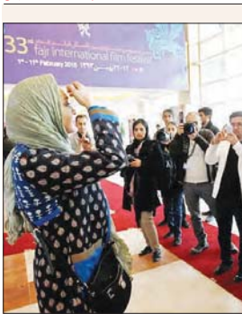
آرامش‌ناکی کوزی، سره‌عکاسان