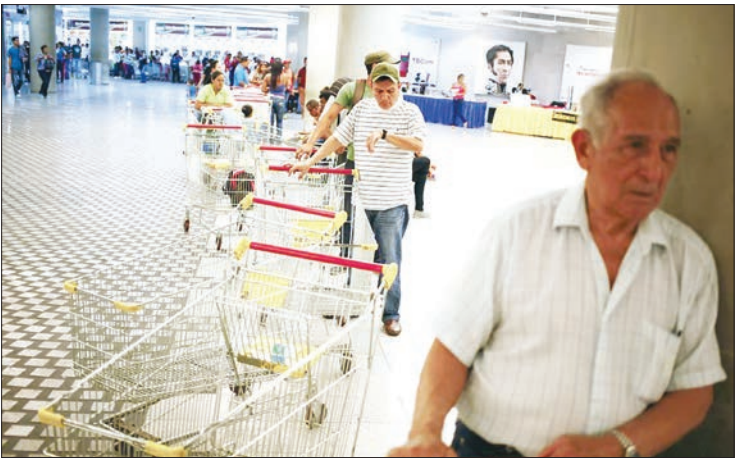
◀ تشکیل صف‌های طولانی برای خرید در کاراکاس

◀ کاراکاس ۸۰۰هزار بشکه نفت را صرف تعهدات از قبل تعیین شده می کند