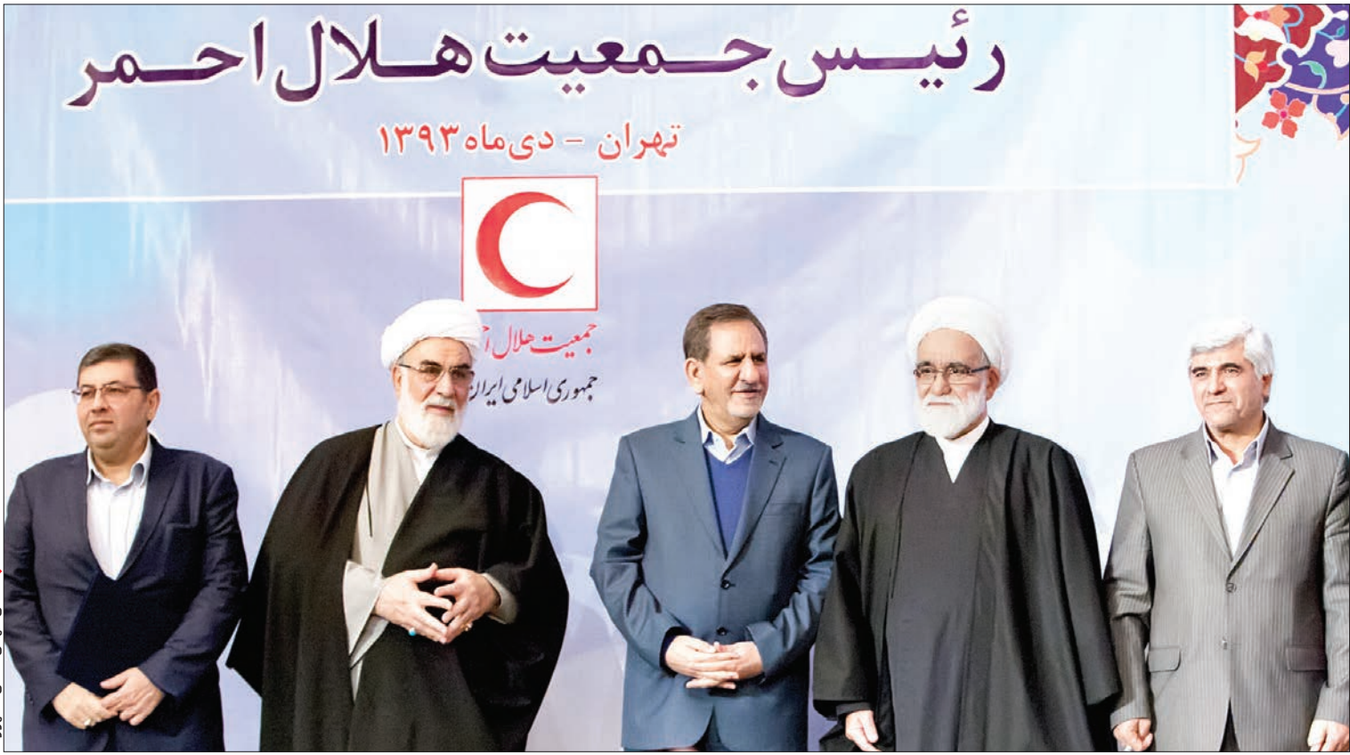
رئیس جمعیت هلال احمر ایران، آیت‌الله محمدی گلپایگانی، رئیس دفتر رهبر معظم انقلاب، و سایر مقامات در مراسم معارفه.

آیت‌الله محمدی گلپایگانی: بسیج ملت عراق علیه داعش در نتیجه سازماندهی ایران بود