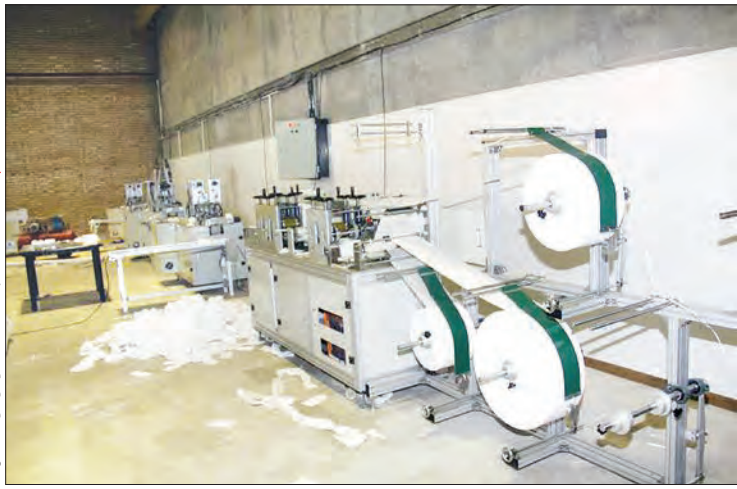
درستگاهتولیدماسکنانو در کارخانه هلال احمر

دندان پزشکیان، پزشکان، پرستاران و کلیه افرادی که در مقوله درمان فعالیت می کنند در معرض انتقال بیماری از سوی بیمار هستند. هدف ما تعمیم این ماسک برای مصرف است، به طوری که الگوی ماسک نسبتاً معمولی را عوض کنیم تا ماسکی با کارایی بالاتر داشته باشیم. ضمناً قیمتی را مدنظر داریم تا افراد مختلف جامعه بتوانند از این محصول بهره ببرند.