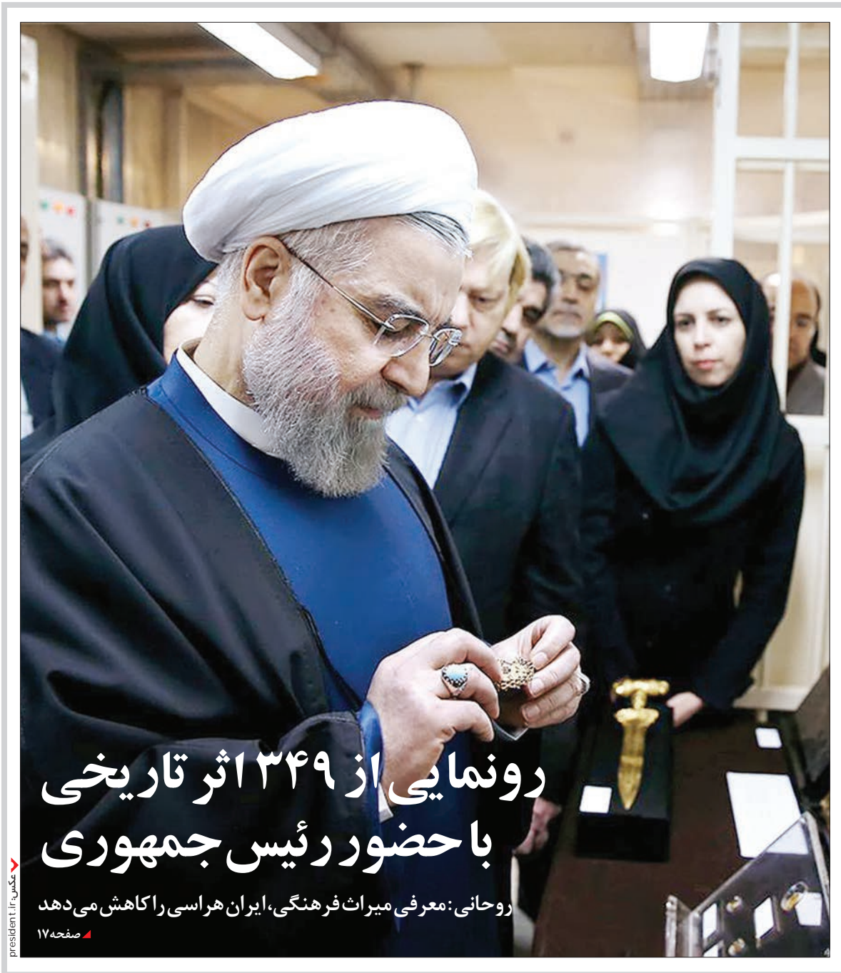
روحانی: معرفی میراث فرهنگی، ایران هراسی را کاهش می دهد

به اسم فساد می خواهند حواس دولت را از پرونده های فعلی منحرف کنند