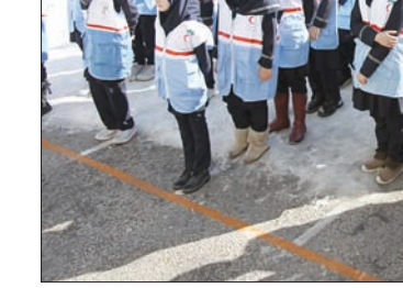
کانون‌های محلی برای یاد دادن و یاد گرفتن

انگیزه من جهت حضور در این مجموعه‌های مردم‌نهاد، خدمت به نیازمندان است. خدمت کردن برای من مثل تفریح است. دلیل دوم بر حضور در این مجموعه‌ها تأثیر بیشتر در جامعه است. ما نسبت به پیرامون خود انسان‌های دیگر مسئول هستیم. بیشتر فعالیت‌ها در جمعیت هلال احمر درمان رایگان بیماران است. جامعه امروز ما نیازمند آموزش در زمینه فرهنگ داوطلبی و فرهنگ نیکوکاری است. رسانه‌ها، دولت، نهادهای آموزشی همه باید با همکاری یکدیگر این فرهنگ پسندیده را در جامعه ترویج دهیم.