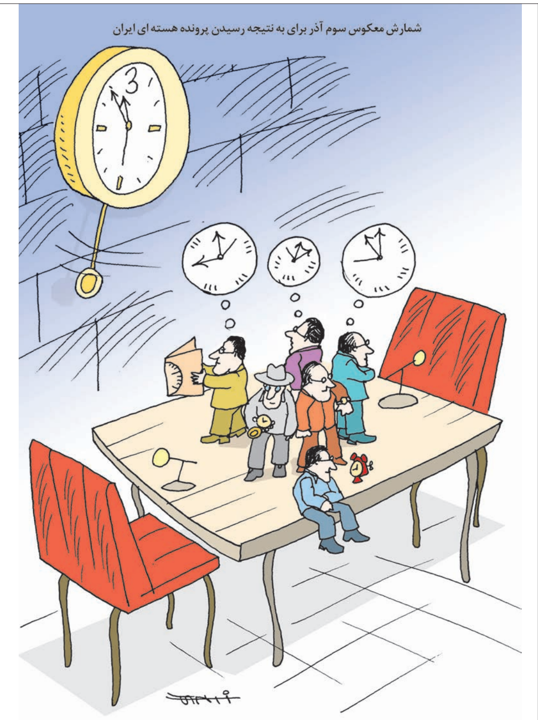
شمارش معکوس سوم آذر برای به نتیجه رسیدن پرونده هسته ای ایران

کیوان زرگری | کار نویسندگانه | keyvanzargari@yahoo.com