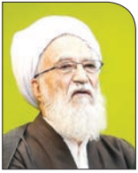
امیر موحّدی کرمانی

عضو جامعه روحانیت مبارز گفت: وحدت اصولگرایان باعث می‌شود برای کشور خطری پیش نیاید و سرنوشته کشور درست رقم بخورد. به گزارش میزان، آیت‌الله محمدعلی موحدی کرمانی در اجلاس دبیران استان‌های حزب مؤتلفه اسلامی در ادامه اظهار کرد: مقام معظم رهبری بارها به فتنه ۸۸ اشاره کرده‌اند و این بی‌دلیل نیست. متأسفانه برخی که برای کشور فداکاری کردند و در دوران پیروزی انقلاب و پیروی از امام حضور داشتند در فتنه به حرف آمریکایی‌ها گوش کردند و اقتدار و امنیت ملی را به خطر انداختند.