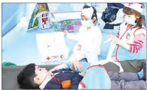
زلزله و ایمنی در مدارس کشور در روز شنبه هشتم آذر ماه با شعار

شهروند! شانزدهمین مانور سراسری زلزله و ایمنی با هدف افزایش سطح آگاهی دانش‌آموزان در مورد زلزله و ایجاد آمادگی برای انجام واکنش‌های صحیح و سریع در برابر آن، آشنایی دانش‌آموزان با زلزله و چگونگی مقابله با آن جهت ایجاد آشنایی روانی و برانگیختن حس کنجکاوی دانش‌آموزان، ایجاد فرهنگ ایمنی و مقاوم‌سازی و در نهایت کاهش تلفات و خسارات ناشی از زلزله نسبت به پدیده‌های طبیعی ۸ اذر به مناسبت «روز ایمنی در برابر زلزله در مدارس» در مدارس سراسر کشور برگزار می‌شود.