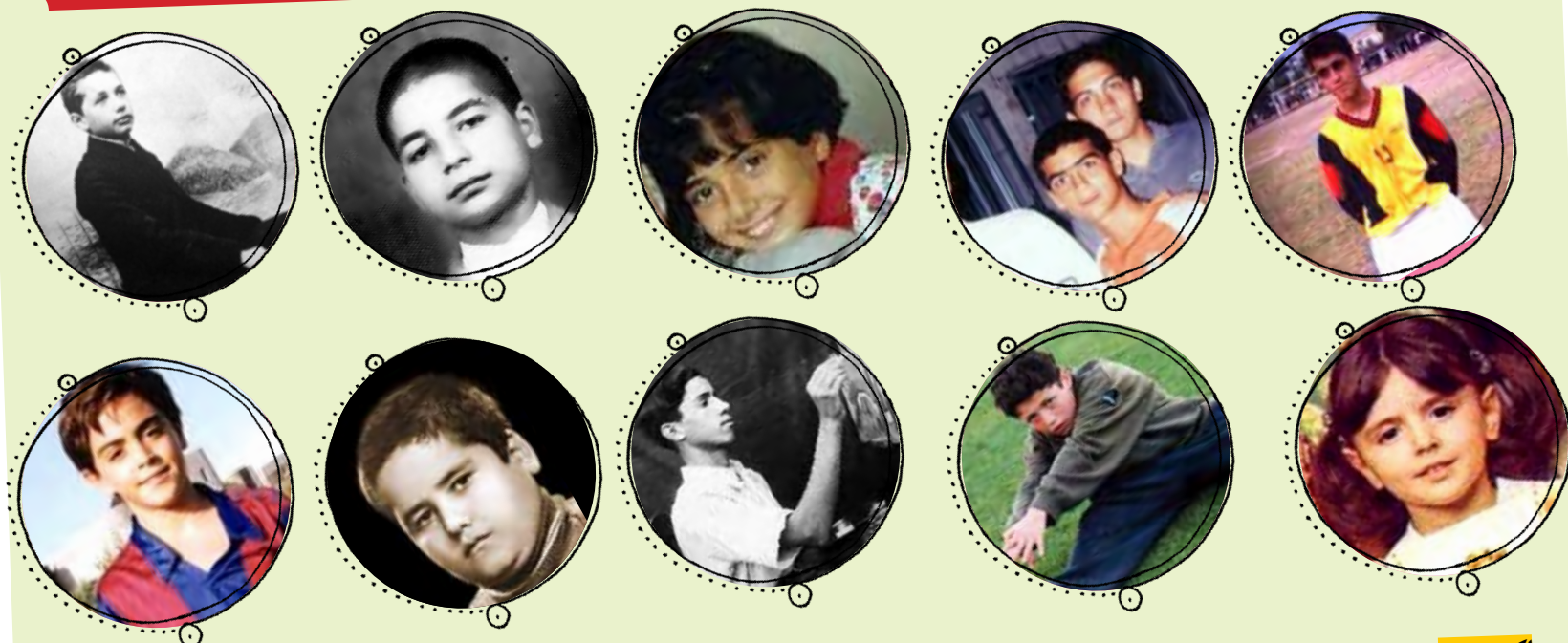
باران کوثری لیونل مسی

اول: نگران جوش‌های قلمبه قلمبه و موهای وزوز و صداهای دورگه نباشید، چون این‌ها نشانه‌ی آن است که شما حتما در آینده کسی می‌شوید برای خودتان! سندن و مدرکش هم عکس‌های همین صفحه! فقط باید در مصرف ترشی زیاده‌روی نکنید.