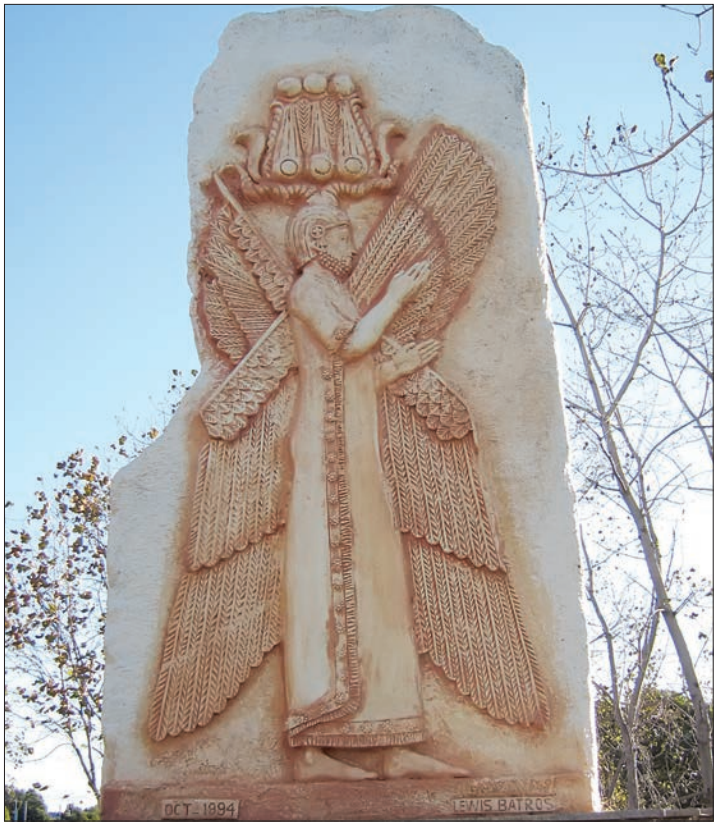
تندیس کوروش کبیر در پارک المپیک سیدجن، تهران (۲۹ اکتبر) که تاریخ نوسان آن را روز ورود کوروش به بابل می داند و به پیشنهاد سازمان بین المللی تجارت پاسارگاد، به نام «روز کوروش» انتخاب و نام گذاری شده است.