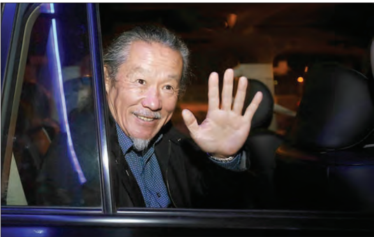
«جادو ابریشم» را نشناسند، بیان داشت: «ما به رسم هدیه تعدادی از سازهای ایرانی را به این هنرمند اهدا می‌کنیم تا بتوانند نماینده خوبی برای معرفی این

سازهای ارزشمند موسیقایی باشد. تپش قلب کیتارو همچنان ادامه دارد کیتارو هم که به همراه تعدادی از اعضای گروه