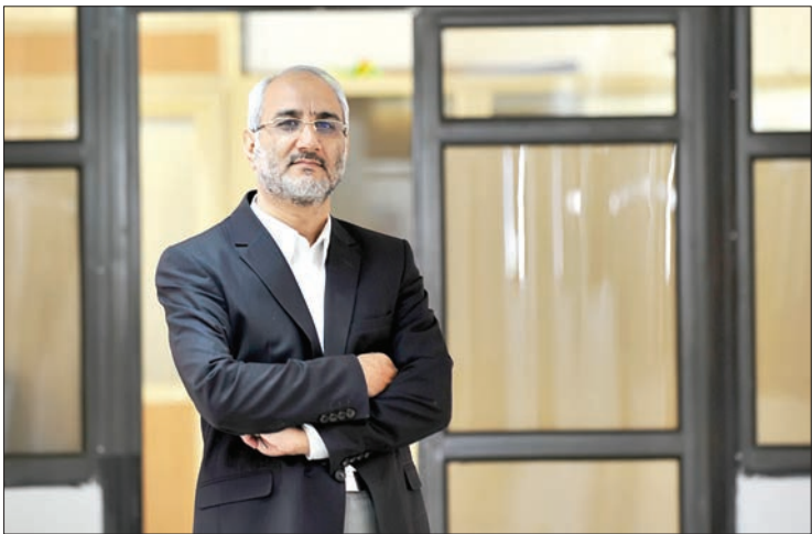
حسین نسیم اقتصادی / شهروند

کشورهای خارج از WTO شانس برای تجارت ندارند ۹۷ درصد تجارت جهان در WTO انجام می‌شود