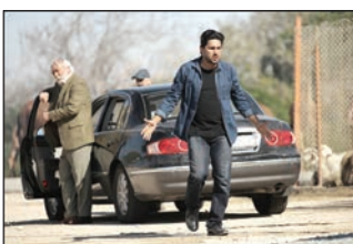
تیزرهای از فیلم مارمولک کمال تبریزی

فیلم سینمایی «رایش غلیظ» به کارگردانی حمید نعمت‌الله در تاریخ ۲۶ شهریور ماه اکران خود را به سرگروهی سینماستقلال آغاز می‌کند.