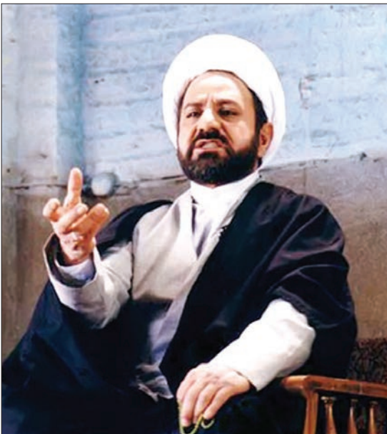
تیزرهای از نسخه‌های سریال مارمولک

و رکوردهای تازه‌ای در زمینه فروش روزانه و فروش کل را از خود به‌جای گذاشت. وقتی اصفهان هم «مارمولک» را از پرده برداشت، فیلم، دیگر در هیچ شهری جز تهران روی پرده نبود و زمزمه مخالفت‌ها علیه فیلم همچنان ادامه داشت. فیلمی که خیلی زود از دایره سینمای ایران خارج و بحث و نظر درباره‌اش به سطح جامعه و تریبون‌های سیاسی، مذهبی کشیده شد. حالا شبکه «ای تی وی» ترکیه این فیلم جنجالی سینمای ایران را مورد اقتباس قرار داده و باید منتظر باشیم تا ببینیم این سریال در ترکیه چه واکنش‌هایی به همراه خواهد داشت.