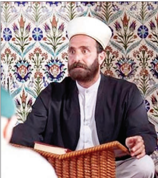
تیزرهای از نسخه‌های سریال مارمولک

شهرنوا مخاطبان شبکه «ای تی وی» ترکیه این روزها شاهد پخش تیزرهایی از سریال جدید این شبکه به نام «مارمولک» هستند. سریالی که به گزارش روزنامه وطن ترکیه با اقتباس از فیلم «مارمولک» به کارگردانی کمال تبریزی که در سال ۸۲ ساخته شد و حواشی بسیاری بر سر اکران آن به وجود آمد، ساخته شده است و به‌زودی از این شبکه به نمایش در خواهد آمد. البته گفته می‌شد «مارمولک» کمال تبریزی هم اقتباسی از «ها فرشته نیستیم» به کارگردانی نیل جردن و با بازی رابرت دنیرو، شن بن و دمی مور بود که در سال ۱۹۸۹ ساخته شده بود. فیلمی که درباره دو محکوم فراری از زندان بود که مجبور می‌شوند برای عبور از مرز، برای مدتی در یک شهر مرزی نقش کشیشان را بازی کنند. فیلم «مارمولک» نوشته پیمان قاسم‌خانی با بازی پرویز پرستویی درباره رضا متقالی معروف به رضا مارمولک دزد سابقه‌داری است که بارها دستگیر و زندانی شده؛ او در حادثه‌ای مجروح می‌شود و به بیمارستان خارج از زندان منتقل می‌شود. در آن جالباس یک روحانی بیمار را می‌باید و در لباس روحانیت موفق به فرار از زندان می‌شود. او با مصونیتی که در لباس تازه پیدا کرده به یک شهرک مرزی می‌رود تا از این طریق و با گذرنامه جعلی از کشور خارج شود اما با همان روحانی‌ای که لباس او را روده اشتباه گرفته می‌شود و امامت جماعت محلی را بر عهده‌اش می‌گذارند. این فیلم اولین‌بار در بیست و دومین جشنواره فیلم فجر به نمایش درآمد، چیزی که همه روی آن اتفاق نظر داشتند. رکورد شکنی‌اش در گیشه بود و کمتر کسی در درس‌ساز شدن آن را پیش‌بینی می‌کرد. این که سازندگان «مارمولک» به شوخی با روحانیت پرداخته و به نوعی از خطوط قرمز گذر کرده بودند در ایام جشنواره چندان با واکنش‌های