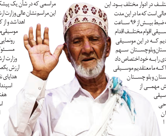
اسپندار در مراسم بزرگداشت