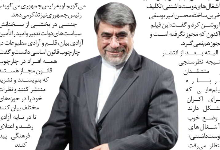
علیرضا نادری نماینده‌نامه‌نویس

شهروند وزیر فرهنگ و ارشاد روزهای شلوغ و پربرنامه‌ای را می‌گذراند. او شامگاه شنبه ۱۸ مردادماه به همراه علی مرادخانی معاون هنری خود، به تماشای کنسرت «چرا قتی» تهمورت پورناظری و همایون شجریان نشست و پس از اجراء، با حضور در پشت صحنه با هنرمندان دیدار و گفت‌وگو کردند. علی جنتی صبح روز بعد (یکشنبه) بعد از جلسه با مدیران کل فرهنگ و ارشاد اسلامی استان‌ها در جمع خبرنگاران حاضر شد و درباره برخی از سوالات و ابهامات موجود در فضای فرهنگ و هنر صحبت کرد. او در پاسخ به سوالی پیرامون حمایت از فیلمسازان گفت: گاهی هنرمندی با فیلمسازی که رابطه نزدیکی با انقلاب ندارد فیلمی می‌سازد که خارج از چارچوب‌های کشور، منافع ملی و نظام و انقلاب نیست و منافاتی با ارزش‌های کشور ندارد و معیارهای کلی را رعایت کرده است؛ قطعاً این فیلم می‌تواند نمایش داده شود اما وقتی فیلمی در راستای نظام و انقلاب است ما از آن حمایت و به آن کمک می‌کنیم. جنتی همچنین درباره نظرات بر تئاتر هاتوضیح داد: بعضی اوقات در اجرای بعضی نمایش‌ها مطالبی دیده می‌شود یا دیالوگ‌هایی گفته می‌شود که در متن اصلی نبوده یا در زیربنی نبوده است. این موارد با بررسی قابل اصلاح است و اگر تخلفی صورت گرفته باشد قطعاً با آن برخورد می‌شود. جنتی در توضیح وضع مجوز «اشغال‌های دوست‌داشتنی» تکلیف آخرین ساختمان‌های امیر یوسفی را روشن کرد و گفت: این فیلم تاکنون که مجوز نگرفته است و مجوز هم نمی‌گیرد. البته بعد از انتشار نتیجه نظر سنجی از منتقدان درباره فیلم‌هایی که برای اکران مشکل دارند وضع خوب «اشغال‌های دوست‌داشتنی» انتظار می‌رفت راه برای اکران این فیلم هموار