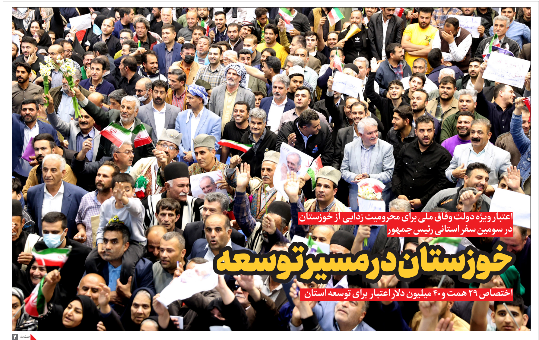
اعتبار ویژه دولت وفاق ملی برای محرومیت زدایی از خوزستان در سومین سفر استانی رئیس‌جمهور