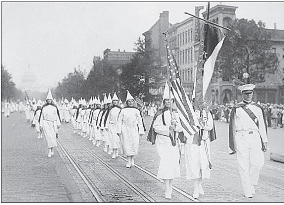
نژادپرستان کوکلاکس کلن‌ها در واشینگتن، ۱۹۲۸

تاریخ فرقه کو کلاکس کلن سرشار از توهین نژادی، خشونت بی‌پروا و حتی ترتیب دادن قتل‌های زنجیره‌ای است. جالب است بدانید پدر مالکوم ایکس، از رهبران سپاه پوستان مسلمانان آمریکا توسط اعضای این فرقه به قتل رسیده است. کو کلاکس کلن‌ها در ابتدای فعالیت خود با بر سر گذاشتن کلاه‌های مثلثی شکل بزرگ که تمام سر را می‌پوشاند و جای حفره چشم‌های آن درآمده بود، سعی داشتند رعب و وحشت ظاهری را نیز تا حد امکان حفظ کنند. تاریخ جنبش حقوق مدنی آمریکا به رهبری مارتن لوتر کینگ که در دهه ۶۰ میلادی به دنبال تساوی حقوق سیاهان و رفع مظاهر تبعیض نژادی بود، مملو از درگیری‌های خونین با اعضای فرقه کو کلاکس کلن است. آن‌ها در این دوران مسئول بسیاری از اعمال خشونت‌بار مانند بمب‌گذاری‌ها و قتل‌ها، علیه فعالان حقوق مدنی و جوامع سپاه پوستان بودند و همه تلاش خود را برای عقیم گذاشتن تلاش‌های سفیدپوستان و سپاهپوستانی که با تبعیض نژادی مبارزه می‌کردند، به‌کار گرفتند.