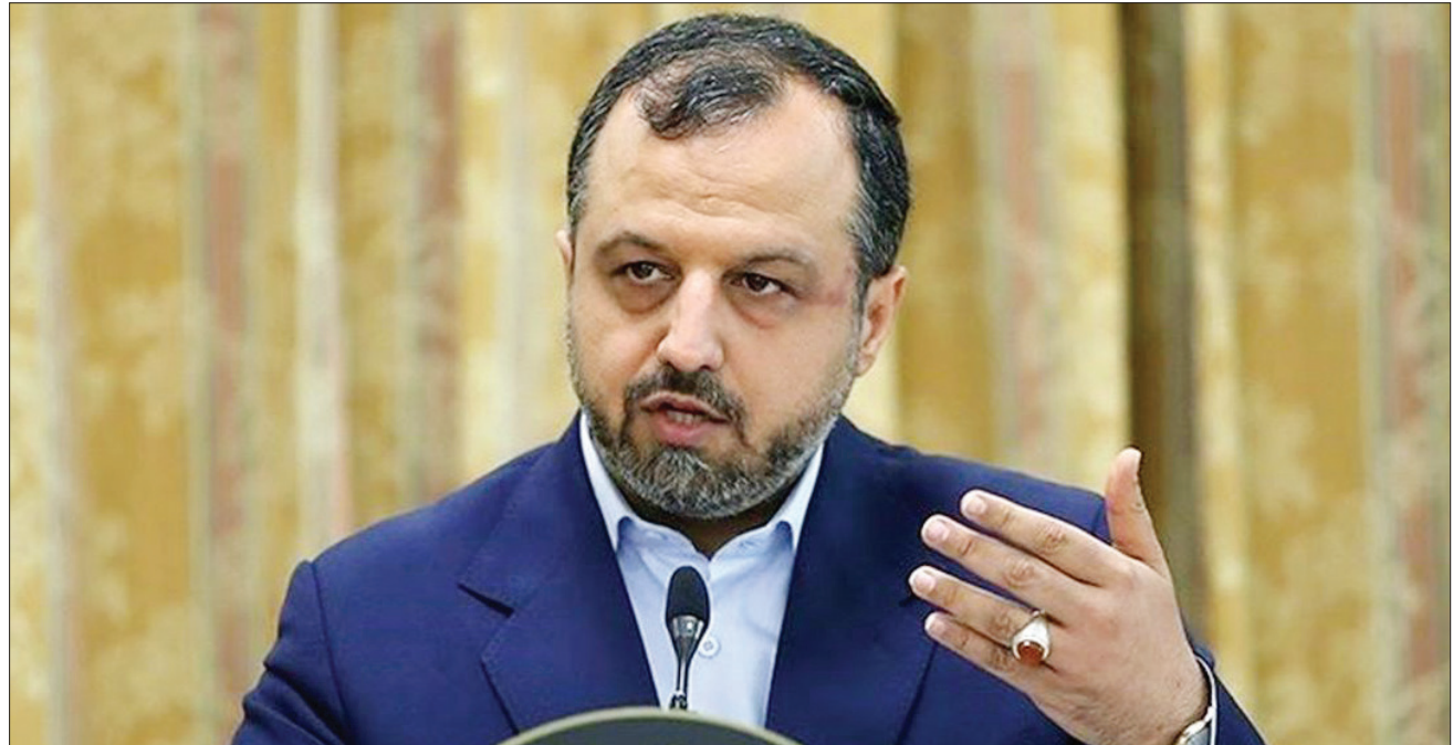
نامه های وزیر اقتصاد به مجمع تشخیص و شورای نگهبان دو هدف مهم دارد؛

رئیس جمهوری در همین خصوص با اشاره به تعیین تکلیف برای بانک ها و مقدرات و معذورات بانک ها اظهار داشت: «بانک ها تسهیلات تکلیفی متعددی پرداخت می کنند که اگر گردش مالی و توان پرداخت آنها مورد توجه قرار نگیرد، الزام به پرداخت تسهیلات جدید برای آنها تکلیف مالاایطاق خواهد بود.»