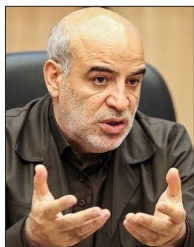
عضو کمیسیون عمران مجلس در گفتگو با «شهرvand» نامه های خاندوزی مشکل گشاست

وزیر امور اقتصادی و دارایی در جمع بندی نامه خود به دبیر شورای نگهبان خاطر نشان کرده است: همانطور که تشریح شده تصویب و اجرای مالیات بر سفته بازی و سوداگری علاوه بر اینکه موجب کاهش انگیزه های سوداگرانه در بازار دارایی های اصلی موازی تولید شامل املاک، خودرو، طلا، ارز و رمز ارز می شود، موجب کاهش بازدهی دارایی های مذکور شده و موجب افزایش انگیزه سرمایه گذاری و رونق تولید خواهد شد. باتوجه به توضیحات فوق و اهمیت موضوع بر اساس مطالبات مقام معظم رهبری (مد ظله العالی) و لزوم آن مطابق اسناد بالادستی مثل سیاست های کلی اقتصاد مقاومتی و سند تحول دولت، تصویب و اجرای این پایه مالیاتی مهم و ضروری است.