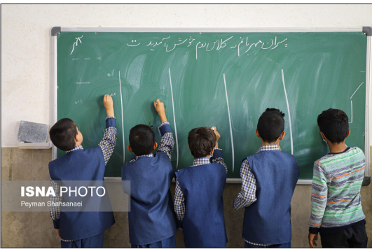
بیشتر دانش‌آموزان این مدرسه، کودکان کار هستند و برخی شب‌ها تا صبح باید کار کنند و صبح به مدرسه می‌آیند. در حالی که ممکن است نیاز به نظافت داشته باشند. به همین دلیل در مدرسه حمام و آب گرم و لیف و صابون و لباس تمیزبیش بینی شده است.