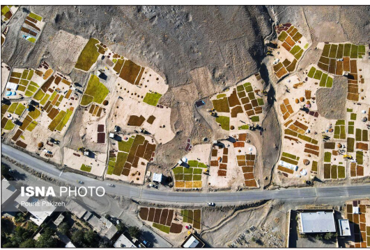
هر سال از اواخر تابستان و برداشت انگور در منطقه «دره جوزان» شهرستان ملایر و روستای «توسک» و «جوزان»، آغاز می‌شود. شهرستان ملایر با وجود دار بودن بیش از ۱۰ هزار هکتار باغات و تاکستان‌های انگور سهم عمده‌ای را در تولید و صادرات کشمش در استان و حتی کشور برعهده دارد.