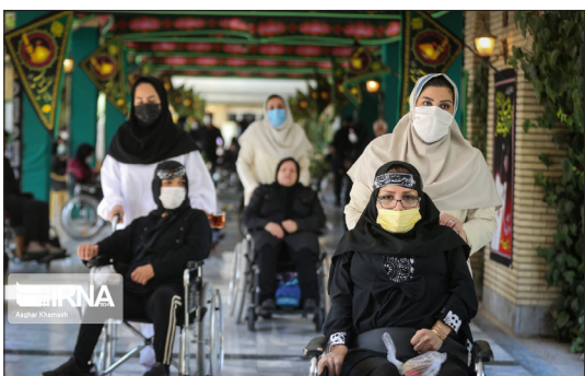
ایرنا- مراسم عزاداری ابا عبدالله الحسین (ع) صبح دیروز با حضور سالمندان و معلولان ساکن در آسایشگاه خیریه کهریز برگزار شد.