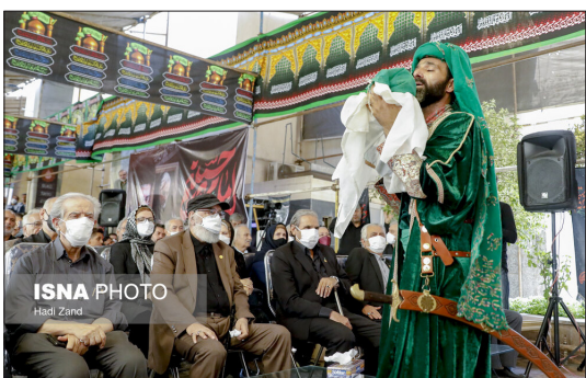
ایسنا- مراسم سوگواری عاشورایی اصحاب فرهنگ، هنر و رسانه با حضور محمد مهدی اسماعیلی، وزیر فرهنگ و ارشاد روز گذشته در حیاط وزارت فرهنگ و ارشاد برگزار شد.