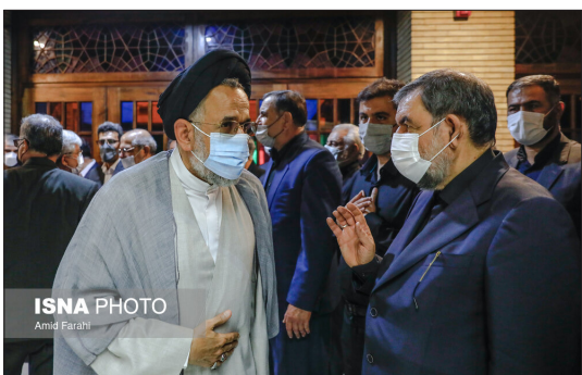
ایسنا- مراسم یادبود دکتر عادل آذر، رئیس اسبق مرکز آمار ایران دیروز در مسجد نور با حضور چهره‌های علمی و سیاسی برگزار شد.