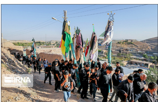
ایرنا- هر ساله روز چهارم محرم آیین سنتی علم‌بندان در روستای درخش خراسان جنوبی برگزار می‌شود. در این مراسم چهارده علم به نام چهارده معصوم بسته و هر یک از علم‌ها با رسم خاصی توسط بزرگ‌خاندان در خانه تزیین شده و سپس علم‌ها در مسجد جامع درخش گرد هم می‌آیند.