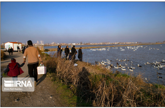
ایرنا- قوهای فریادکش مهاجر تالاب سرخورد در چند هفته گذشته به دلیل کمبود غذا وارد دامگاه‌ها شده بودند که با تلاش نیروهای حفاظت محیط زیست استان مازندران و تامین ذرت برای آنان، این پرنده‌گان مهاجر در چند روز اخیر به تالاب بازگشتند.