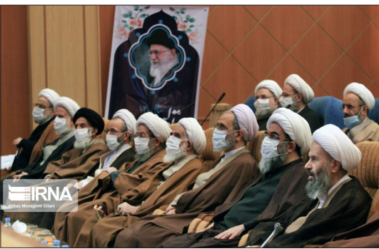
ایرنا- دوازدهمین اجلاس هیئت جامعه مدرسین حوزه علمیه قم و علمای بلاد روز پنجشنبه با شعار «رسالت حوزه‌های علمیه در تحقق و دفاع از اهداف و آرمان‌های انقلاب، با سخنرانی ویدیو کنفرانسی رئیس جمهوری در قم برگزار شد.»