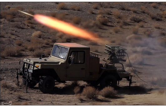
تسنیم - آزمایش مشترک و ترکیبی نیروی زمینی سپاه با نام محمد رسول الله (ص) با محوریت جغرافیایی و عملیاتی قرارگاه قدس در استان سیستان و بلوچستان به صورت ترکیبی در دوفاز بزرگ رزمی- نظامی و مردم‌باری- غیرنظامی برگزار شد.