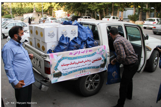
باشگاه خبرنگاران جوان - سیزدهمین مرحله از آزمایش مواد است و همدلی با محوری، و محرومیت زدایی و آزادسازی زندانیان جرائم غیر عمد و زمینه آموزشی و فرهنگی در مناطق محروم استان البرز، عصر سه شنبه ۲۵ خرداد ۱۴۰۰ در مصلی شهر کرج برگزار شد.