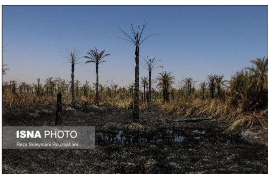
ایسنا- ساعت ۲۳.۲۱ خردادماه حدود ۹ هکتار از نخلستان های اروندکنار دچار حریق شد. در این آتش سوزی بیش از ۲ هزار و ۲۰۰ نخل شمر در اروندکنار در آتش سوخت. در این آتش سوزی علاوه بر نخیلات، بخشی از نزارهای منطقه نیز دچار حریق شد.