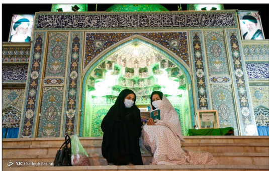
باشگاه خبرنگاران جوان - جعفرین موسی کاظم (شاهرضا) از فرزندان بلافضل امام موسی کاظم، به امر برادر خود امام رضا (ع) برای ارشاد مردم به اصفهان سفر کرد که به دست ظالمان حکومت اموی در دامنه کوهی در سال ۲۰۴ هجری قمری به شهادت رسیده است.