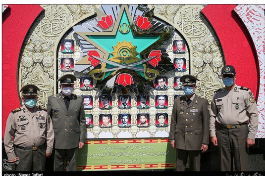
تسنیم - مراسم پاسداشت سالروز اعطای نشان فداکاری به دانشگاه افسری امام علی (ع) از سوی فرمانده معظم کل قوا صبح دیروز چهارشنبه ۲۶ خردادماه با حضور سرلشکر سید عبدالرحیم موسوی، فرمانده کل ارتش، سرتیپ کیومرث حیدری، فرمانده نیروی زمینی ارتش و جمعی از فرماندهان و خانواده شهدا برگزار شد. در این مراسم برخی از خانواده های شهدای ارتش نشان فداکاری دانشگاه افسری امام علی (ع) را از فرمانده کل ارتش دریافت کردند و از تمرب یادبودین نشان نیز رونمایی شد.