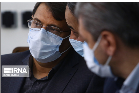
ایرنا - جلسه ستاد تنظیم بازار.