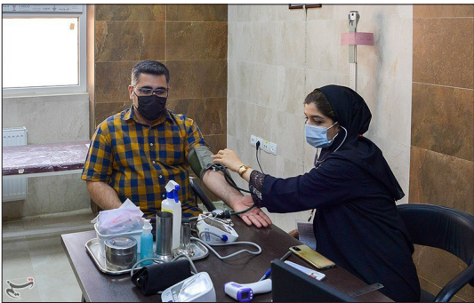
تسنیم - فاز سوم واکسن کووید ایران برکت در مرکز جامع سلامت علی بن ابیطالب شیراز صبح دیروز با حضور آیت الله لطف الله در کام نماینده ولی فقیه در استان فارس و امام جمعه شیراز جمعی از مسئولین استانی به همت دانشگاه علوم پزشکی شیراز و ستاد اجرایی فرمان امام افتتاح شد.