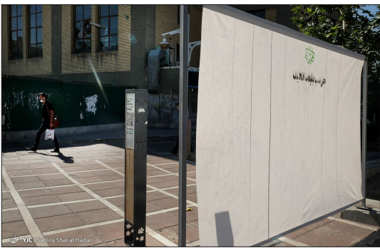
باشگاه خبرنگاران جوان - با گذشت حدود ۱۵ روز از اعلام نهایی اسامی کاندیداهای انتخابات ریاست جمهوری ۱۴۰۰ همچنان شاهد بازار کم رونق تبلیغات انتخاباتی در سطح شهر تهران هستیم.