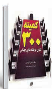
کمیته ۳۰۰ (کانون توطئه جهانی) نویسنده: جان کولمن مترجم: یحیی شمس ناشر: مروارید و فیروزه ۳۶۶ صفحه ۱۹ هزار تومان

□ یکی از اهداف «کمیته ۳۰۰» تبلیغ مصرف مواد مخدر و قانونی کردن آن است و تبدیل فیلم‌های پورنوگرافی به یک «فرم هنری» که مورد پذیرش واقع و به طور گسترده استفاده شود. به عنوان آخرین تحول، می‌توانیم گزارش دهیم که پورنوگرافی تا سال ۲۰۰۴ جای خود را در «فرهنگ عامه» محکم می‌کند و تئاتر در استرالیا آشکارا پورنوگرافی را نمایش می‌دهد. به این مسأله «برنامه‌نویسی واقعیت» گفته می‌شود.