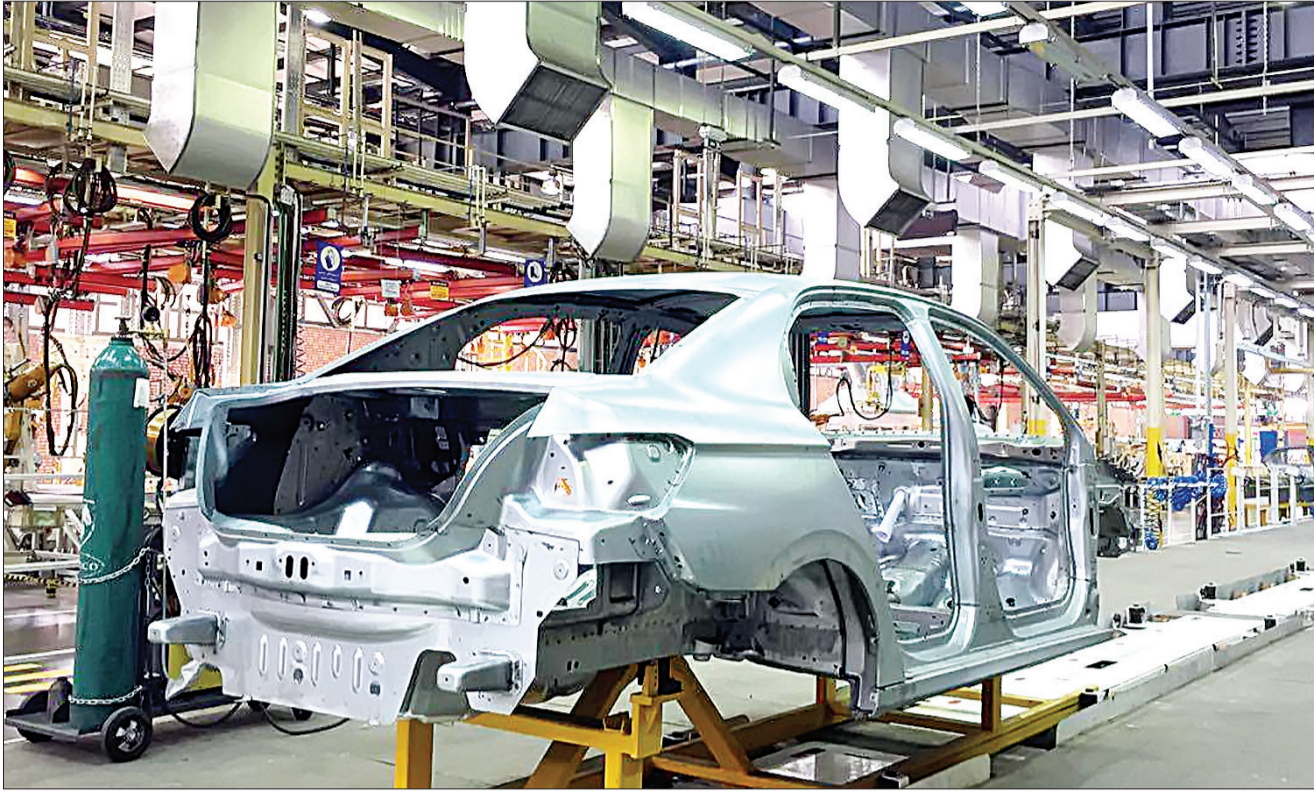
خبرگزاری عصر ایران

رئیس کل بانک مرکزی از ادغام بانک‌های نظامی تا ۱۰ روز آینده خبر داد. عبدالناصر همتی در اینستاگرام خود نوشت: در ادامه روند ادغام بانک‌های وابسته به نیروهای مسلح طرف ۱۰ روز آینده با برگزاری مجامع «بانک‌های اقتصاد» و «بانک حکمت‌ایران» ادغام این دو بانک در بانک سپه نهایی شد. هم‌جمع‌سهم‌انگاری باقی‌مانده دیگر نیز، به تدریج برگزار خواهد شد. بانک مرکزی مسیر اصلاح نظام بانکی و ارتقای سلامت مالی بانک‌ها را با جدیت ادامه خواهد داد. همتی همچنین به پرداخت تسهیلات کرونایی اشاره کرد و گفت: «نظام بانکی کشور طبق وعده‌ای که داده است، آماده پرداخت ۵۰ هزار میلیارد تومان تسهیلات بانرخ سود ۱۲ درصد به مشاغل و واحدهای کسب و کار که به خاطر شیوع ویروس کرونا آسیب دیده‌اند است. به محض دسترسی بانک‌ها به سامانه مربوط به اطلاعات مشاغل و نیز واحدهایی که واجد شرایط استفاده از این وام هستند و توسط وزارت تعاون، کار و رفاه اجتماعی در این خصوص ایجاد شده است، بانک‌ها نیز ظرف یک هفته تقاضاها را بررسی و اقدام لازم را انجام خواهند داد.»