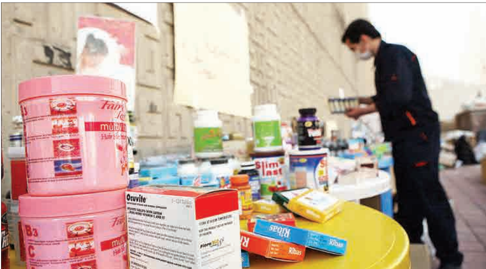
جام جم □

حسختن‌گی سازمان غذا و دارو: تعدادی از متخلفان بازداشت شده‌اند، دستگیری‌های بعدی هم در راه است