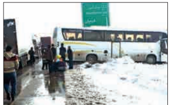
تصادف زنجیره‌ای ۳۰ خودرو در محور مشهد - سبزوار

سی خودرو سواری و کامیون صبح سه‌شنبه به‌طور زنجیره‌ای در مسیر جاده سبزوار- نیشابور با یکدیگر برخورد کردند که ۱۲ مجروح بر جای گذاشت. این حادثه در ۱۲ کیلومتر پنج جاده سبزوار- نیشابور به دلیل لغزندگی سطح جاده در پی بارش شدید برف رخ داد. بلافاصله پس از وقوع این سانحه رانندگی تکنیسین‌ها، بالگرد امدادی و آمبولانس‌های اورژانس در محل سانحه حضور یافتند و به معاینه و مداوای اولیه مجروحان پرداختند. افراد جراحات دیده تصادف زنجیره‌ای با بالگرد اورژانس هوایی و سه دستگاه آمبولانس به بیمارستان امداد شهید بهشتی سبزوار اعزام شدند. □