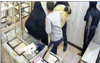
سرقت مسلحانه از طلافروشی در شهرک طالقانی

سرقت مسلحانه از طلافروشی در شهرک طالقانی شهرستان ماهشهر منجر به زخمی شدن دو نفر شد. در این سرقت مسلحانه سارقان با خودرو سواری دست به سرقت زدند، دو نفر را زخمی کردند و از صحنه جرم متواری شدند. پلیس سرخ‌هایی از عاملان این سرقت به دست آورده و تلاش برای دستگیری متهمان آغاز شده است. □