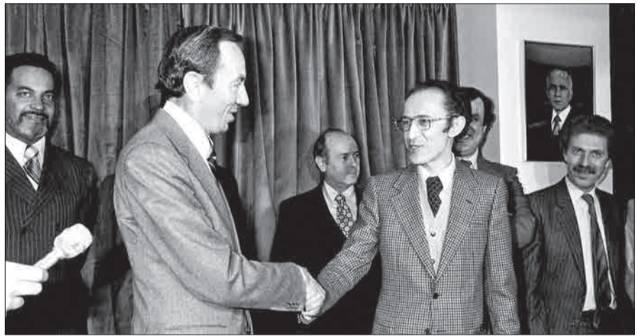
وارن کریستوفر وزیر خارجه آمریکا (چپ) و محمد صدیق بن یحیی وزیر خارجه الجزایر - ۱۹۸۱ [۱]

← هفتاد و چهار سال پیش در چنین روزی، برابر بیستم ژانویه ۱۹۴۶ میلادی، دیوید لیتچ، کارگردان صاحب سبک سینمای آمریکا در مونتانا به دنیا آمد. آثار لیتچ بیش از آنکه مخاطب عام داشته باشد محبوب منتقدان و مخاطبان خاص سینماست و شاید درست به همین دلیل با وجود دریافت جوایز متعدد هیچ گاه موفقیت بزرگی در گیشه کسب نکرده اند. سال ۲۰۰۳ در نظر سنجی از منتقدان فیلم در سراسر دنیا، دیوید لیتچ عنوان بزرگترین فیلم ساز زنده دنیا را از آن خود کرد. [۱]