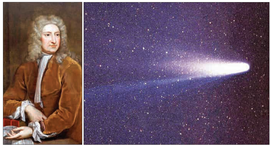
ادموند هالی آخرین تصویر ثبت شده از هالی در سال ۱۹۸۶