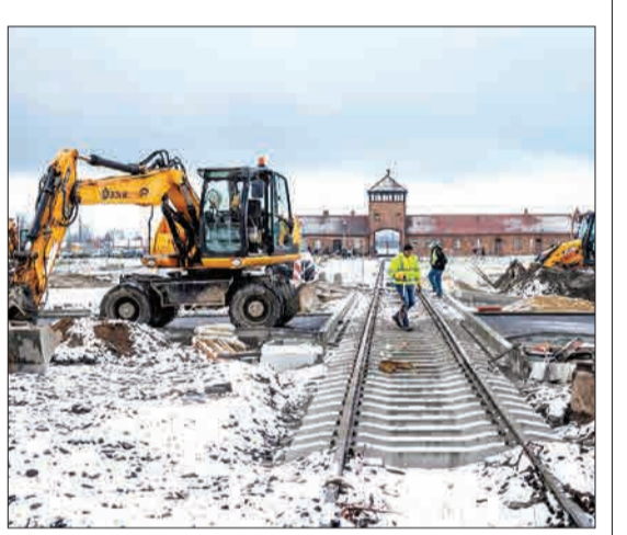
لهستان - کارگران در حال ساختن جاده‌ای در مقابل دروازه اصلی اردوگاه آشوتیس هستند.