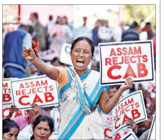
گواهاٹی، هند - زنی که در جریان اعتراض‌ها علیه ورود مهاجران و دادن تابعیت به آنها فریاد می‌زند.