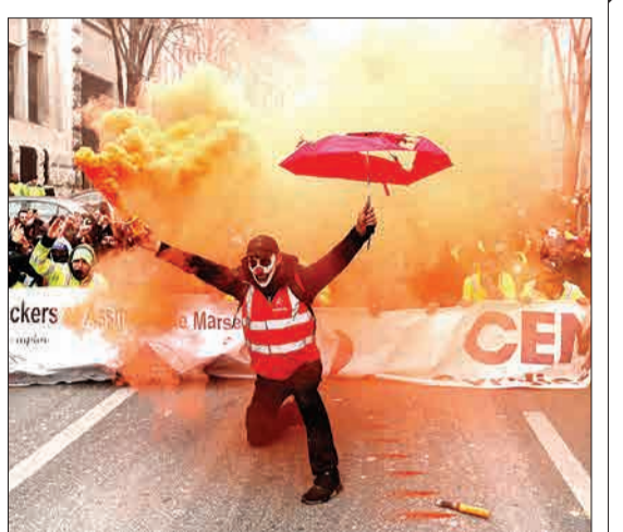
مارسی، فرانسه - یک معترض با ماسک، یک دود را در دست گرفته است.