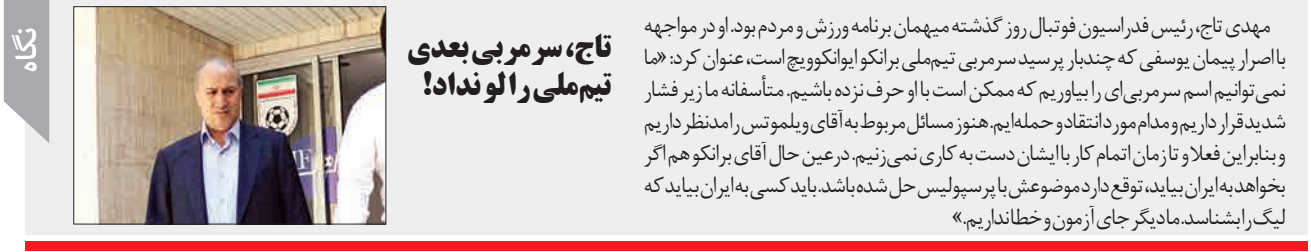
تاج، سر مربی بعدی تیم ملی را لو نداد!

مهدی تاج، رئیس فدراسیون فوتبال روز گذشته میهمان برنامه ورزش و مردم بود. او در مواجهه با صراحت پیمان یوسفی که چندبار پرسید سر مربی تیم ملی برانکو ایوانکوویچ است، عنوان کرد: «ما نمی‌توانیم اسم سر مربی‌ای را بیابیم که ممکن است با حرف نزه باشی. متأسفانه ما زیر فشار شدید قرار داریم و مدام مورد انتقاد و حمله‌ایم. هنوز مسائل مربوط به آقای ویلموتس را مدنظر داریم و بنابراین فعلاً تا زمان اتمام کار با ایشان دست به کاری نمی‌زنیم. در عین حال آقای برانکو هم اگر بخواهد به ایران بیاید، توقع دارد موضوعش با پرسپولیس حل شده باشد. باید کسی به ایران بیاید که لیگ را بشناسد. مادریگر جای آزمون و خطا نداریم.»