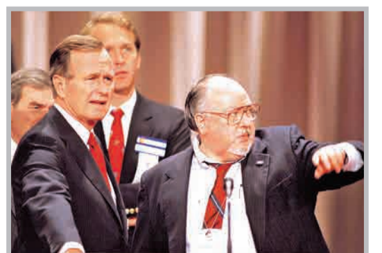
راجر ایلز مشاور چند تن از روسای جمهور آمریکا بوده است. او به ریگان، بوش پدر، بوش پسر و حتی ترامپ مشاوره رسانه‌ای داده است. در این عکس او را در کنار بوش پدر می‌بینید.