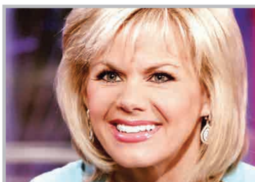
گرچن کارلسون مجری خبر فاکس نیوز بود که بارها مورد آزار جنسی راجر ایلز قرار گرفت و در نهایت تصمیم گرفت به طور رسمی از او شکایت کند. در سریال نقش کارلسون را ناتومی واتس بازی می‌کند.

ترامپ باور دارد فاکس نیوز یکی از منصف‌ترین منابع خبری است. او همیشه فاکس نیوز را تماشا می‌کند و معمولاً بخش‌هایی از گفت‌وگوهای این شبکه خبری در پیام‌های ترامپ در شبکه اجتماعی توئیتر دیده می‌شوند. شبکه سی‌ان‌ان در برنامه «منابع معتبر» تمایل ترامپ به تکرار دیدگاه‌های شبکه فاکس نیوز را مطرح