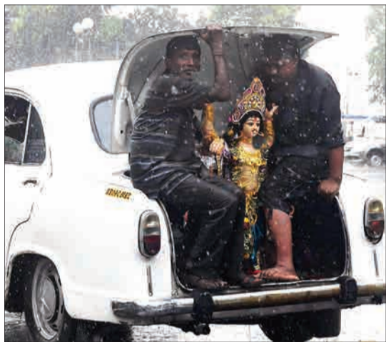
کلکته، هند - میدان هندو در حال جابه‌جا کردن مجسمه ویشواکار مادر زیر باران هستند