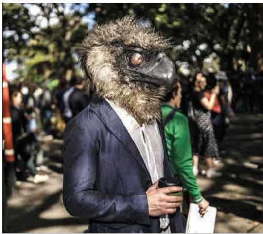
سیدنی، استرالیا - یکی از معترضان در اعتراض بزرگ آب و هوایی لباس یک پرنده را پوشیده است.