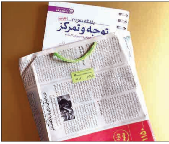
استفاده از روزنامه‌های باطله به جای کیسه‌های پلاستیکی در فروشگاه‌های کتاب به همت جمعیت زنان مبارز با آلودگی محیط زیست مشهد.