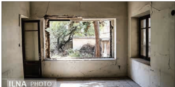
وضعیت وخیم‌خانه‌متر و کم‌نیم‌بوشیخ (اینا)