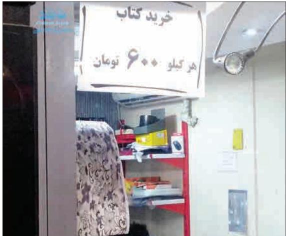
خرید کیلویی کتاب (خبر فوری)