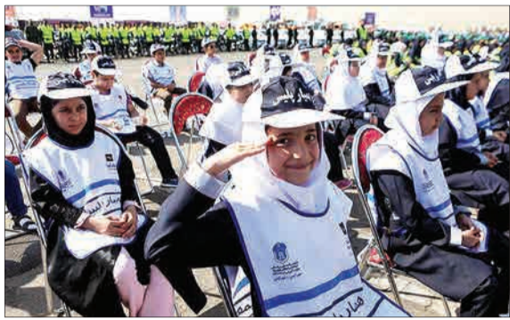
رزمایش «مهر ایمن، شهر ایمن» روز گذشته با حضور سازمان‌ها و ارگان‌های مرتبط با امور ترافیک، حمل و نقل، ساماندهی و خدمات رسانی شهری در بوستان ولایت تهران برگزار شد. همانطور که در این تصویر می‌بینید از بعضی دانش‌آموزان هم‌پایه‌پایه دعوت شده بود.