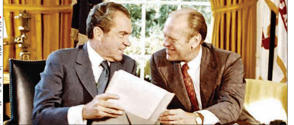
ریچارد نیکسون (راست) و معاونش جرالد فورد - ۱۹۷۳

لورفتن ماجرای شنودفیبی (پلیس فدرال) از محل ستاد انتخاباتی حزب دموکرات آمریکا واقع در هتل واترگیت و اشیانگتن، به خودی خود برای نیکسون خطر تلقی نمی‌شده. اما کار وقتی بیخ پیدا کرد که او با تحویل مدارک این رسوایی به کنگره مخالفت کرد. بعدها که به حکم دیوان عالی فدرال، کاخ سفید اسناد واترگیت را در اختیار کمیته قضائی مجلس نمایندگان آمریکا قرار داد، در آنها سندی یافت شد که نشان می‌داد نیکسون به سازمان سیا دستوراتی در خصوص توقف تحقیقات در ماجرای واترگیت را صادر کرده است. همین سند کافی بود تا مجلس نمایندگان آمریکا استیضاح رئیس جمهوری را در دستور کار خود قرار دهد. هنگامی که نیکسون در یافت رأی آوردن استیضاح قطعی است، به شرط عدم تعقیب قضائی حاضر به استعفا شد. پس از او معاونش جرالد فورد قدرت را در کاخ سفید به دست گرفت و در دست یک ماه بعد نیکسون را عفو کرد. البته فورد نیز از این جریانات بی نصیب نماند و بعد از شکست در انتخابات بعدی، عنوان تنها رئیس جمهوری آمریکا که بدون انتخابات وارد کاخ سفید شد را از آن خود کرد.