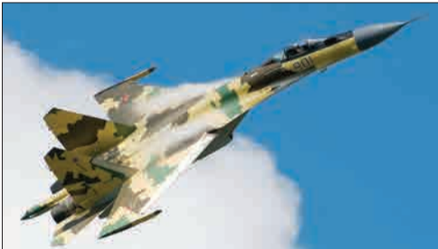
سوخو ۳۵، یکی از سلاح‌های حیاتی و مورد نظر ایران

صادرات هر گونه سلاح - از متعارف تا غیرمتعارف - به ایران را ممنوع اعلام کرد. به این ترتیب تحریم نانوشته صنایع دفاعی ایران با این قطعنامه شکلی رسمی به خود گرفت. جالب است بدانید این شورا بیشتر یعنی در سال ۲۰۰۷ میلادی با تصویب قطعنامه ۱۷۴۷ واردات سلاح از ایران را نیز ممنوع اعلام کرده بود و به این ترتیب ایران در پایان سال