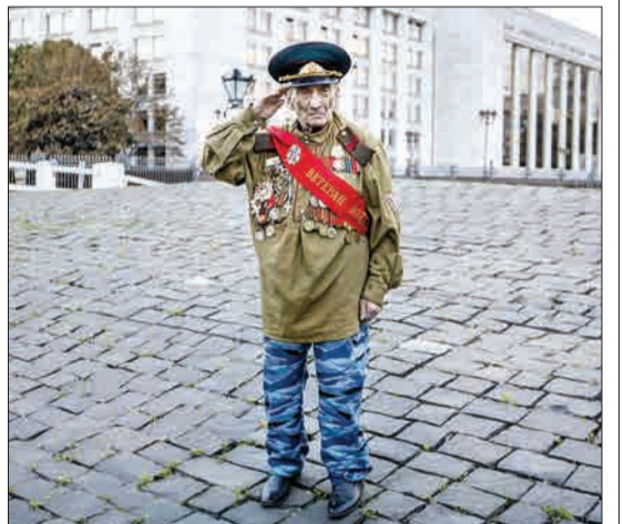
مسکو، روسیه - کهنه سرباز جنگ جهانی دوم با ۹۲ سال سن، در انتظار سایر کهنه‌سربازان است تا در مراسمی شرکت کنند.