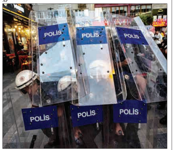
استانبول، ترکیه - پلیس با معترضان به حذف شهرداران کرد در سه شهر مقابله می‌کند.